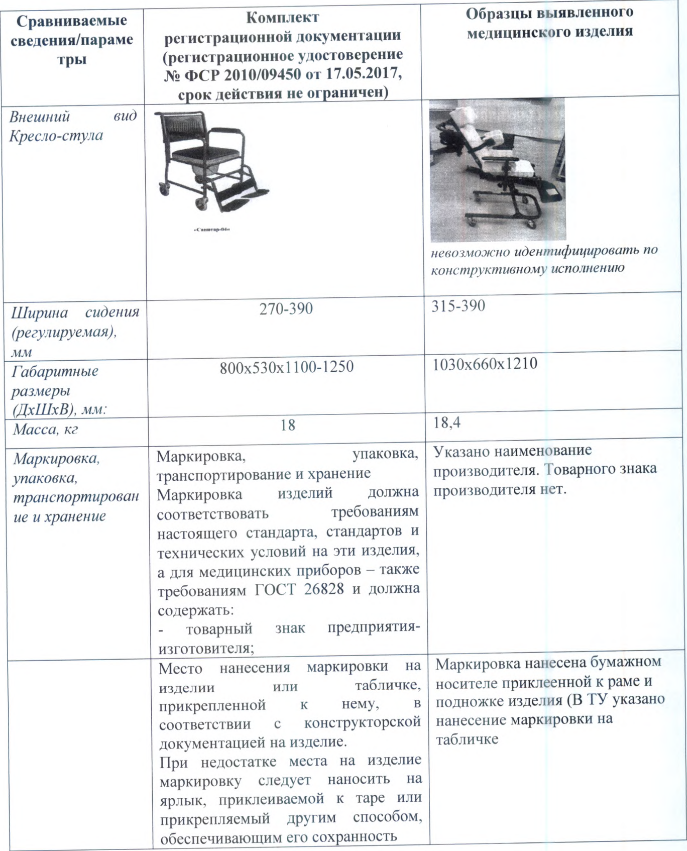
Таблица сопоставления параметров и характеристик, указанных в комплекте регистрационной документации, с параметрами и характеристиками образцов выявленного медицинского изделия