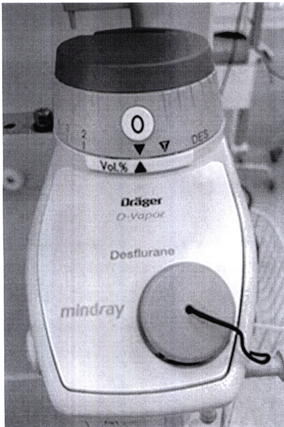
Испаритель десфлурана D-Vapor, производства «Дрегерверк АГ унд Ко. КГаА», Германия