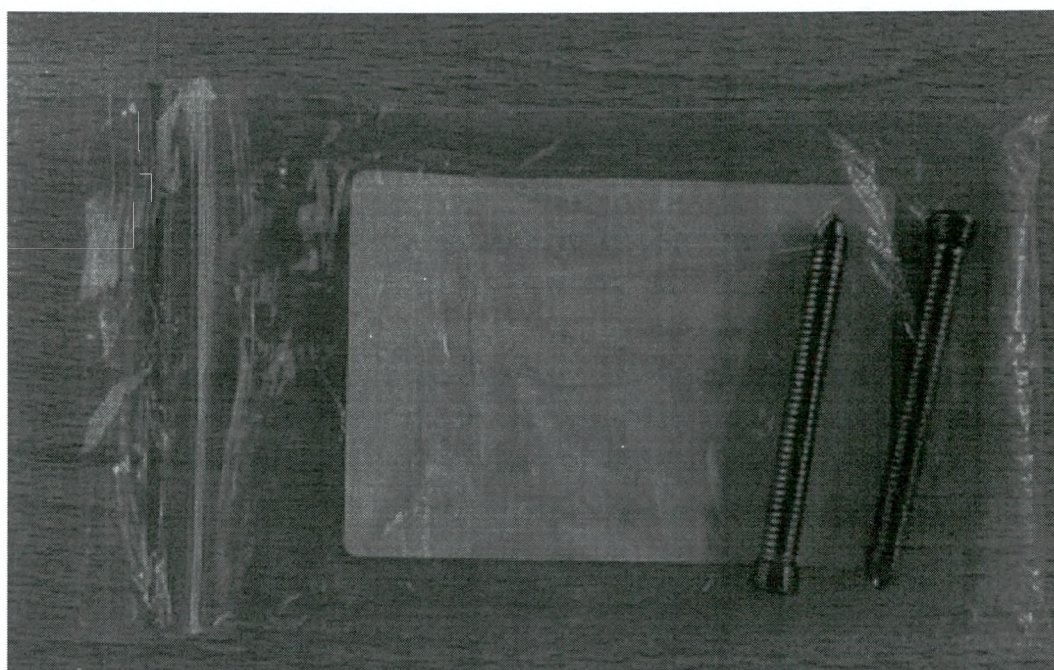
Внешний вид и упаковка изделия