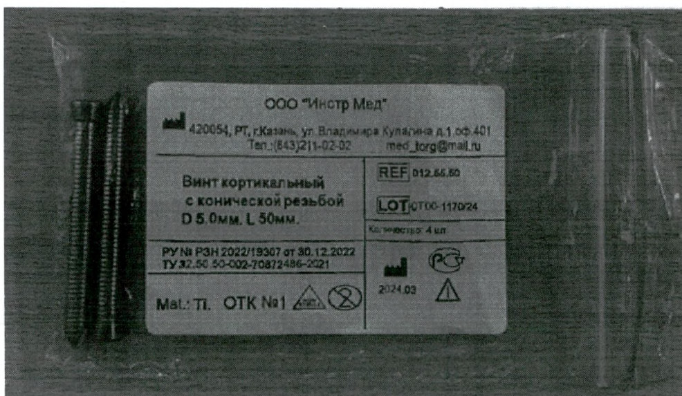
Внешний вид индивидуальной упаковки и маркировка изделия