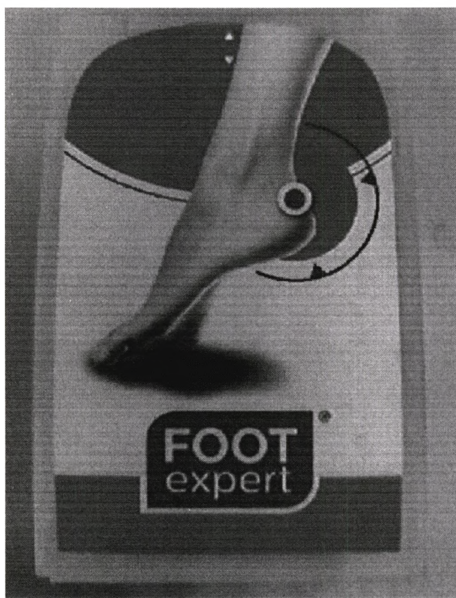
Внешний вид потребительской упаковки