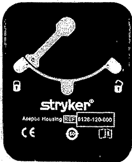
Фотография 1. Номер изделия указан белым цветом на внешней поверхности крышки. Прямоугольная рамка желтого цвета на крышке изделия отсутствует. Она была добавлена на изображение для выделения номера изделия.

На приведенных ниже фотографиях указано расположение номера изделия и номера партии. Примечание. Данное уведомление об отзыве касается только партий 13205, 13209, 13210 и 13212.